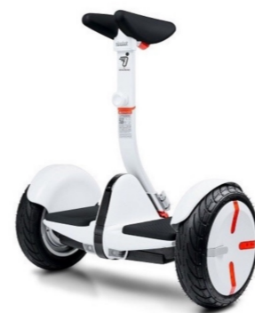
ナインポット (ミニ)

企画・運営 EARTHLING mobility 担当 加藤・森下 TEL 090-5459-1600 MAIL info@mottoasobu.com