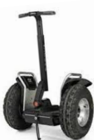
オフロード セグウェイ